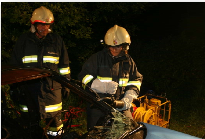
Übung mit Schere und Spreizer