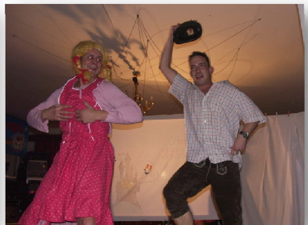
Kommandant bei nächtlichem Treiben