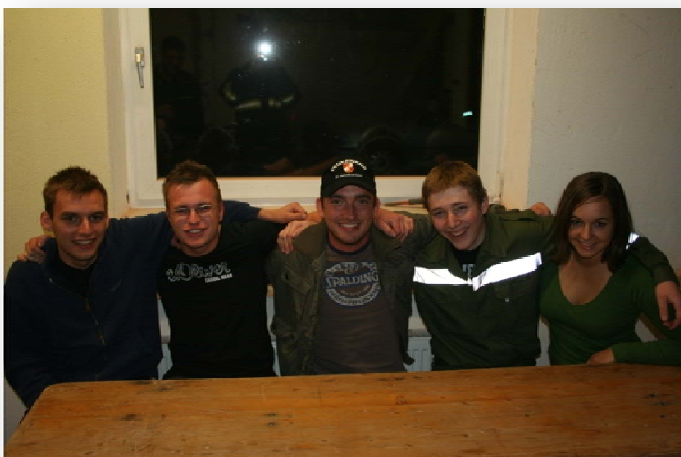
FuLA Silber Teilnehmer mit Kommandant