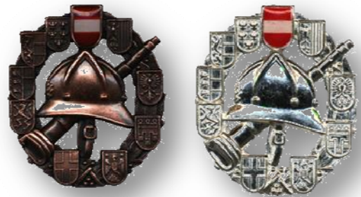
Feuerwehrleistungsabzeichen in Bronze und Silber

Eine besondere Freude ist es uns jedenfalls, dass Kamerad Peterseil Benedikt im Rahmen des Bewerbs in Ried im Innkreis, das bronzene und silberne Leistungsabzeichen erlangt hat!